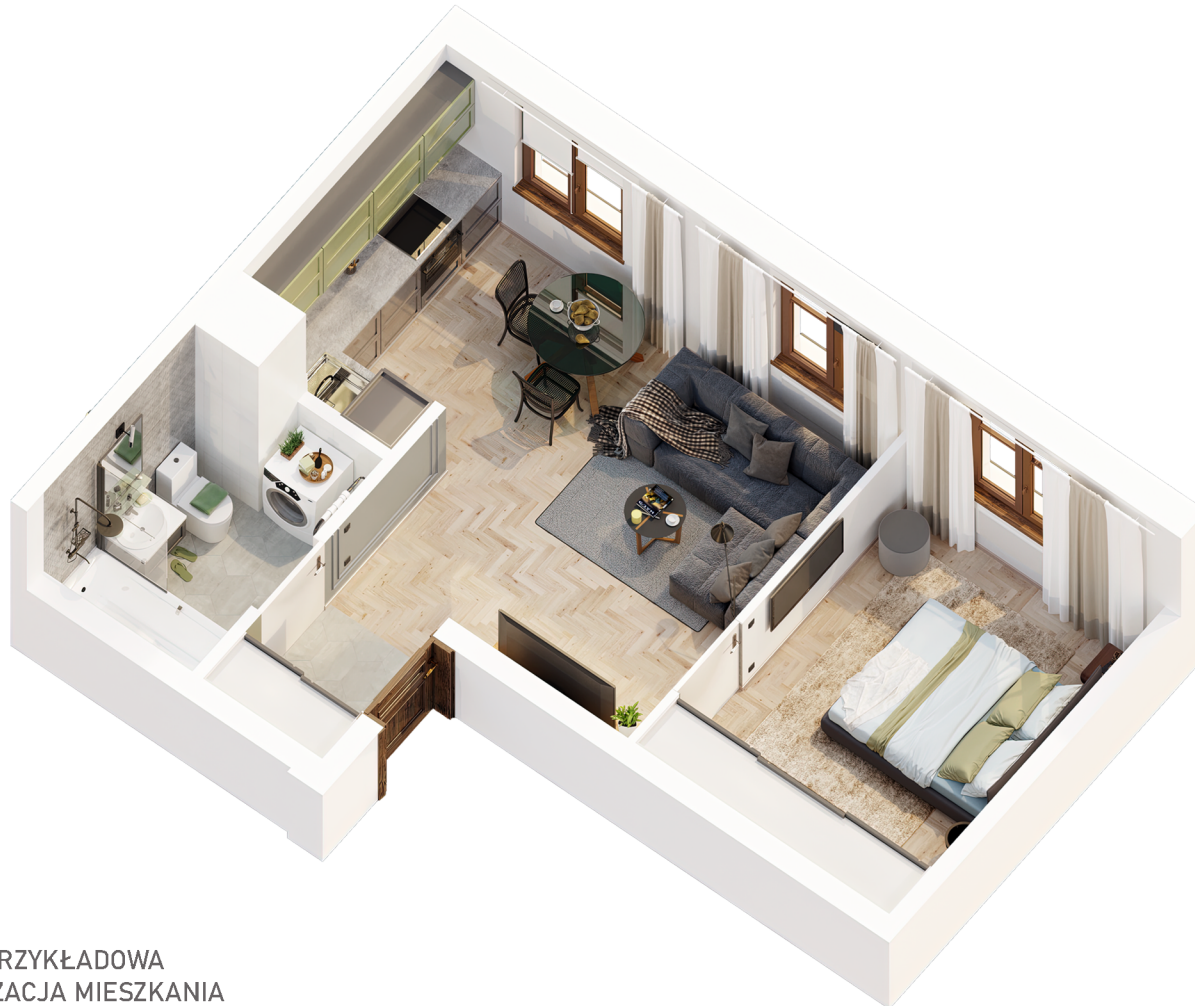
PRZYKŁADOWA ARANŻACJA MIESZKANIA

Niniejsza karta katalogowa opracowana została na podstawie projektu budowlanego i służy wyłącznie do wskazania położenia poszczególnych pomieszczeń. Nie jest ona wiernym odwzorowaniem mieszkania i nie stanowi wiążącego opisu prezentowanego lokalu. Wyposażenie mieszkania widoczne na karcie służy tylko celom prezentacji i nie stanowi zobowiązania umownego. Powierzchnię mieszkania policzono wg normy PN-ISO 9836-1997, przyjęta grubość tynku to 1,5 cm. Ze względu na twające prace budowlane powierzchnie mogą ulec zmianie.