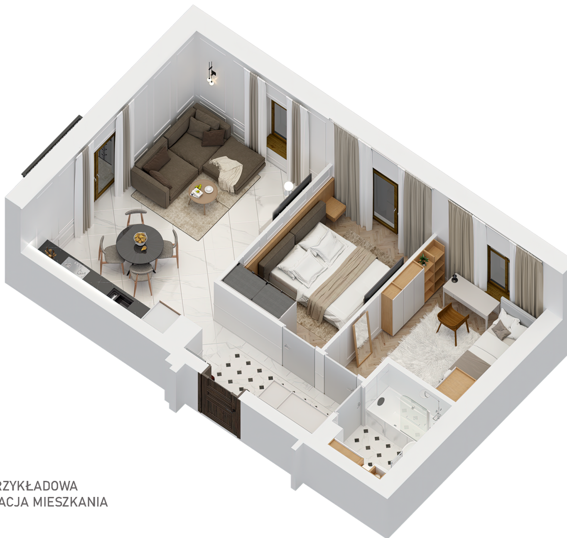
PRZYKŁADOWA ARANŻACJA MIESZKANIA

Niniejsza karta katalogowa opracowana została na podstawie projektu budowlanego i służy wyłącznie do wskazania położenia poszczególnych pomieszczeń. Nie jest ona wiernym odwzorowaniem mieszkania i nie stanowi wiążącego opisu prezentowanego lokalu. Wyposażenie mieszkania widoczne na karcie służy tylko celom prezentacji i nie stanowi zobowiązania umownego. Powierzchnię mieszkania policzono wg normy PN-ISO 9836-1997, przyjęta grubość tynku to 1,5 cm. Ze względu na twójce prace budowlane powierzchnie mogą ulec zmianie.