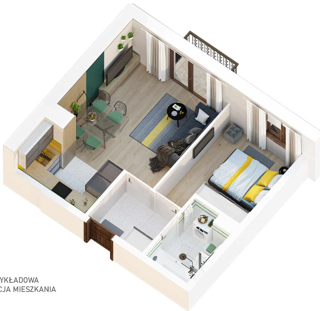
PRZYKŁADOWA ARANŻACJA MIESZKANIA

Doskonała lokalizacja w przestrzeni 15 minut.