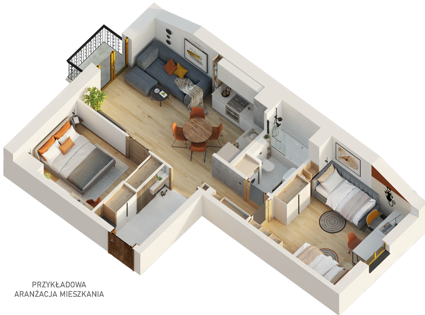
PRZYKŁADOWA ARANŻACJA MIESZKANIA

Niniejsza karta katalogowa opracowana została na podstawie projektu budowlanego i służy wyłącznie do wskazania położenia poszczególnych pomieszczeń. Nie jest ona wiernym odwzorowaniem mieszkania i nie stanowi wiążącego opisu prezentowanego lokalu. Wyposażenie mieszkania widoczne na karcie służy tylko celom prezentacji i nie stanowi zobowiązania umownego. Powierzchnię mieszkania policzono wg normy PN-ISO 9836-1997, przyjęta grubość tynku to 1,5 cm. Ze względu na twające prace budowlane powierzchnie mogą ulec zmianie.