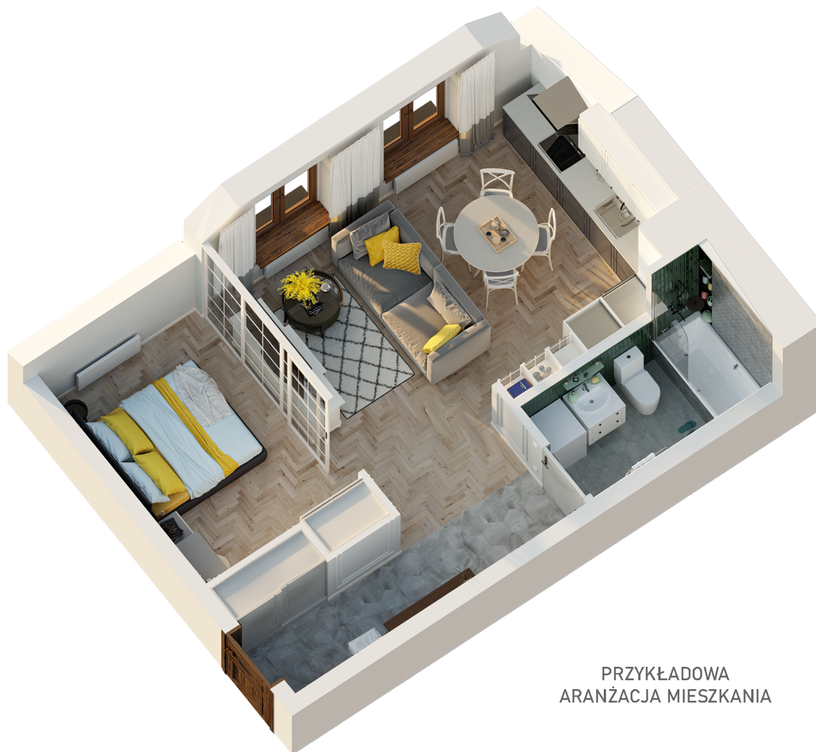
PRZYKŁADOWA ARANŻACJA MIESZKANIA

Niniejsza karta katalogowa opracowana została na podstawie projektu budowlanego i służy wyłącznie do wskazania położenia poszczególnych pomieszczeń. Nie jest ona wiernym odwzorowaniem mieszkania i nie stanowi wiążącego opisu prezentowanego lokalu. Wyposażenie mieszkania widoczne na karcie służy tylko celom prezentacji i nie stanowi zobowiązania umownego. Powierzchnię mieszkania policzono wg normy PN-ISO 9836-1997, przyjęta grubość tynku to 1,5 cm. Ze względu na twójce prace budowlane powierzchnie mogą ulec zmianie.